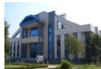
Санаторий «Кубанская Нива», г. Анапа