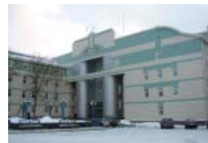
Комплекс зданий УМНС г. Москва. Походный проезд. Архитектор Сорокин Ю.И.