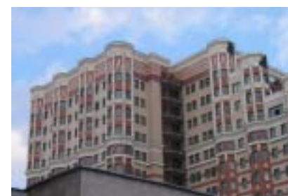
Административное здание МВД России, г. Москва, ул. Житная, производитель работ «ДИАТ». Архитектор Пащенко Б.Л. ГУП «Моспроект-2» им. М.В. Посохина, мастерская 5

– Сейчас сотрудники нашего бюро перегружены, а нам хотелось бы самим осуществлять авторский надзор за строительством, также необходимо иметь возможность предлагать как можно больше вариантов сложных моментов в проектах. Поэтому возможно увеличение штата сотрудников. Мы стремимся, чтобы нашими непосредственными заказчиками были проектные организации, хотелось бы теснее сотрудничать с авторами-архитекторами как раньше, когда мы работали в проектном институте параллельно над всеми проектами. Хочу сказать, что фасадами заниматься очень интересно. Получаешь удовольствие, большой заряд бодрости и вдохновения для будущей работы, когда видишь красивый готовый фасад и довольного заказчика. ■