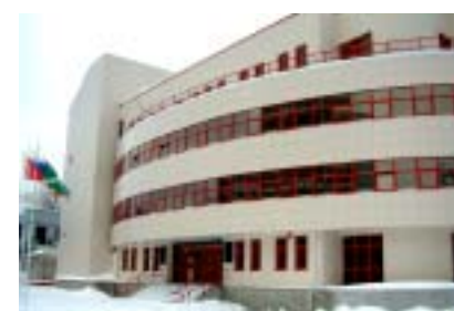
Административное здание. Авиапосёлок «Внуково». Архитектор Плеханов М.В. «Моспроект-2», мастерская 1